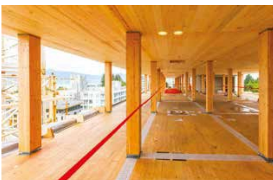
Un edificio in legno lamellare in costruzione.

Le EPD sono solitamente redatte semplificando gli scenari di fine vita, con l'adozione di modelli di smaltimento o riciclo generici che non considerano le effettive pratiche locali di gestione dei rifiuti o l'efficacia dei sistemi di riciclo esistenti. Come evidenziato da diversi studi, le variazioni nella densità del legno e nelle pratiche di fine vita introducono incertezze significative nei valori di GWP, che sono in larga parte conseguenza di una mancanza di standardizzazione.