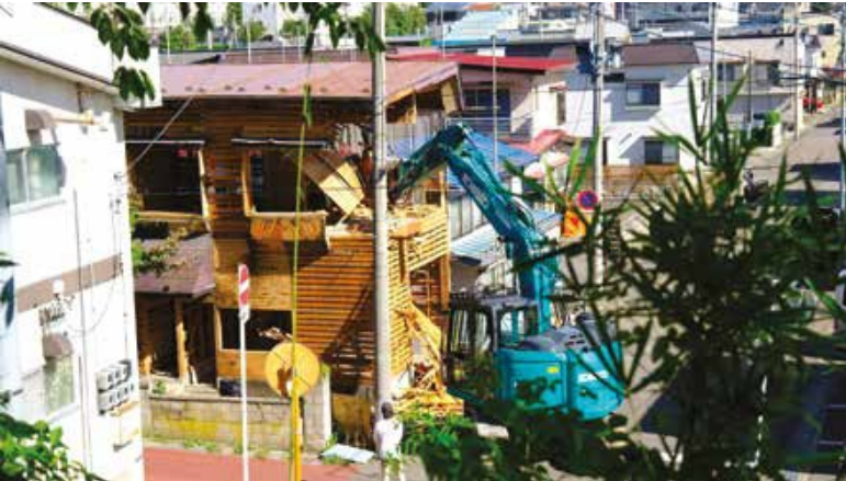
Un edificio in legno durante la sua demolizione.

re pienamente i vantaggi ambientali del materiale. Un nodo cruciale risiede nel trattamento semplificato del sequestro di carbonio biogenico, che spesso trascura variabili fondamentali come il tempo di stoccaggio, la specie legnosa, le condizioni di crescita e le pratiche di gestione forestale. Ulteriori imprecisioni derivano da confini di sistema non uniformi e dall'impiego di dati di impatto generici provenienti da database LCA, che possono non riflettere adeguatamente le specificità regionali e i processi produttivi locali.