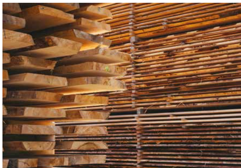
Tavole in legno che vengono incollate per produrre CLT e GLT.

Un trend che si rileva è che il fine vita del legno lamellare è