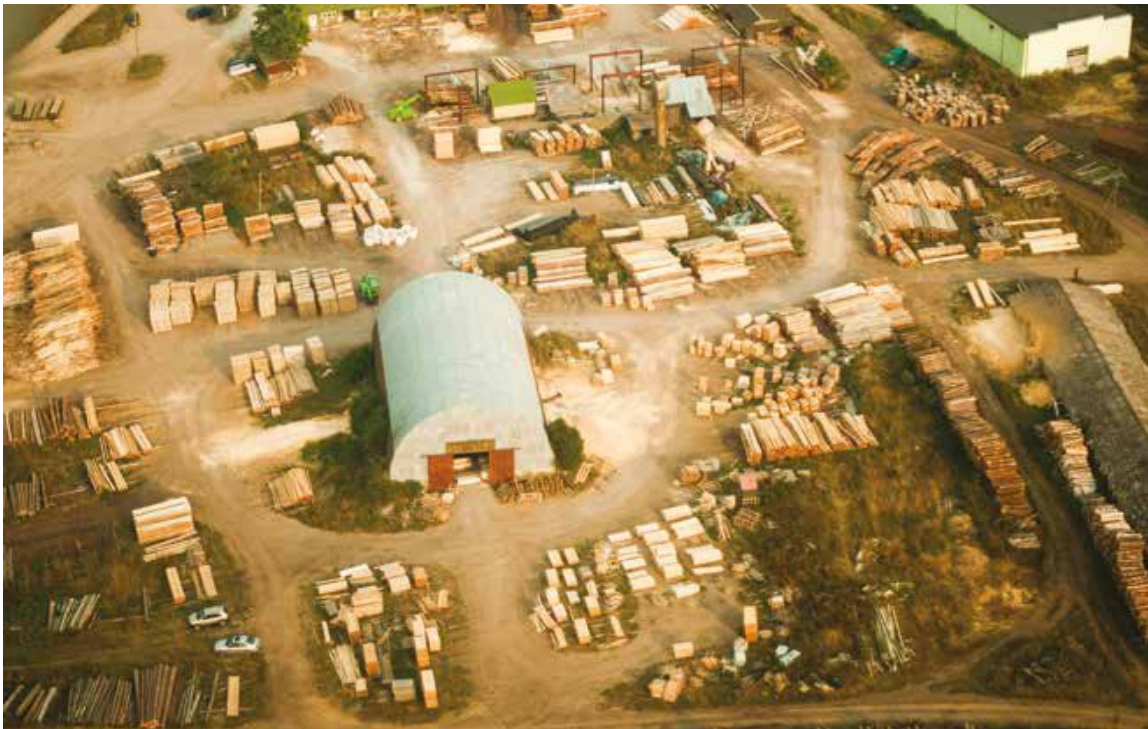
Un'azienda di produzione di legname, dove si conclude la fase A3.

In questo contesto di crescente attenzione alla sostenibilità ambientale, il legno lamellare, nelle sue diverse configurazioni, emerge come un materiale costruttivo di primaria importanza per il mercato globale ed europeo in particolare. Nello specifico, i pannelli in legno lamellare incrociato (Cross Laminated Timber, CLT) e il legno lamellare incollato