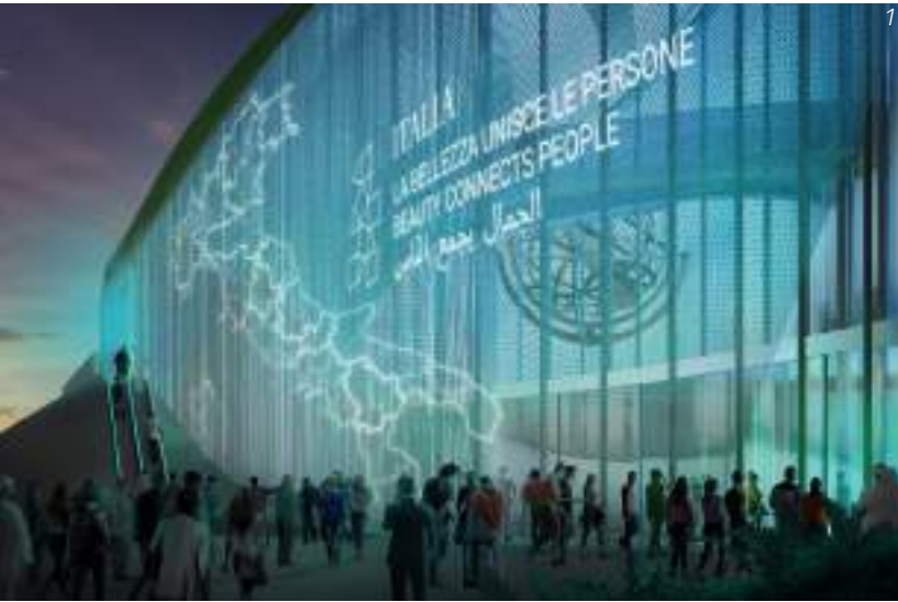
Opere: 1. Padiglione Italia, Expo 2020, 2. Samaritaine, Parigi