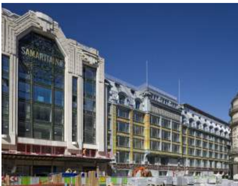
La Samaritaine, Parigi

E più ci interfacciamo negli anni con strutture molto articolate, più ne capiamo i limiti e più ci spingiamo ad accettare sfide sempre più ardite, sempre certi della capacità di soddisfare le richieste del cliente.