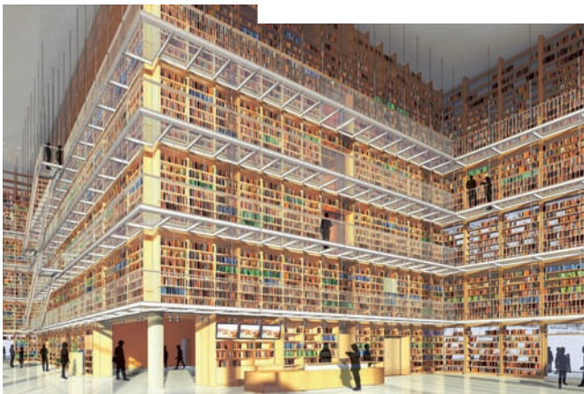
A destra: ripresa fotografica dell'ingresso alla Library Sotto: Rendering della lobby della Library