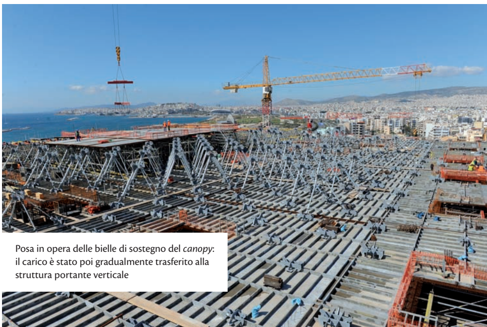
Posa in opera delle bielle di sostegno del canopy: il carico è stato poi gradualmente trasferito alla struttura portante verticale