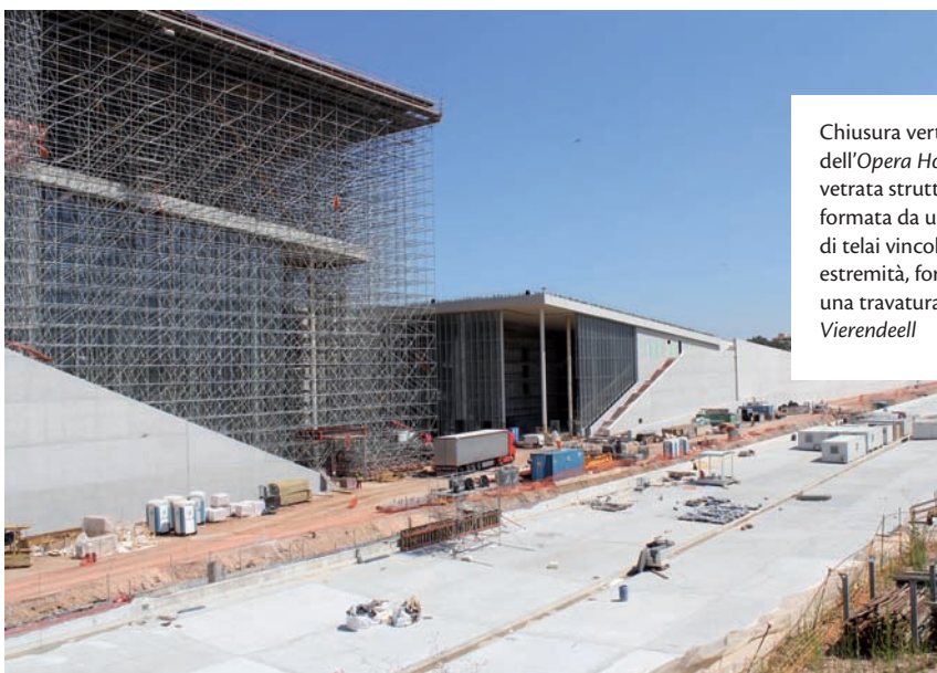
Chiusura verticale dell'Opera House: vetrata strutturale formata da una teoria di telai vincolati alle estremità, formando una travatura Vierendeell

Lo Stavros Niarchos Foundation Cultural Center (SNFCC) è un complesso multifunzionale in via di completamento a Kallithea un sobborgo del Pireo, cinque chilometri a ovest di Atene. L'ampio lotto in cui si inserisce aveva ospitato l'ippodromo durante i giochi olimpici del 2004; successivamente è stato utilizzato come terminal delle autolinee e parcheggio; una soluzione non sistematizzata, che ha portato l'area ad una condizione di degrado. La Fondazione Stavros Niarchos ne ha ottenuto la proprietà condizionata alla realizzazione di una struttura pubblica ed ha avviato i lavori di costruzione nel gennaio del 2013. La conclusione delle opere è prevista entro il 2016.