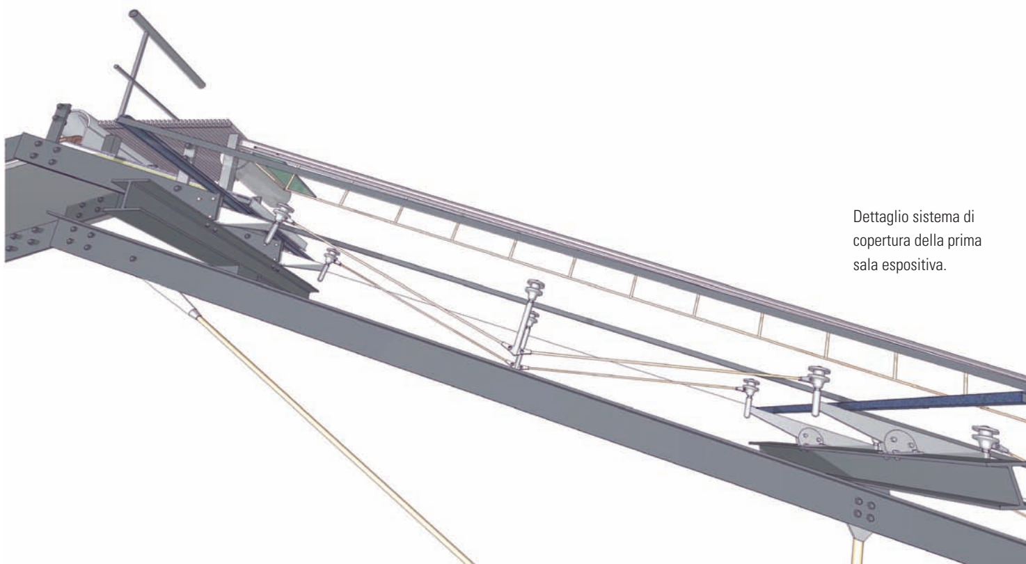
Dettaglio sistema di copertura della prima sala espositiva.

Gli interni trovano il giusto contrappunto nel grande cortile in basole laviche, che si spiega per tutta la lunghezza delle fabbriche mentre sul fronte opposto si affaccia l'auditorium.