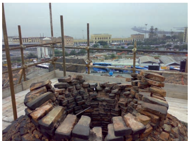
Il coronamento della ciminiera durante le fasi di smontaggio e rimontaggio dei mattoni laterizi.

L'Ateneo ha avviato la fase di completamento del Museo, perfezionando la scelta e collocazione delle installazioni in esso contenute, così da giungere alla sua apertura che dovrebbe avere luogo presumibilmente entro l'anno.